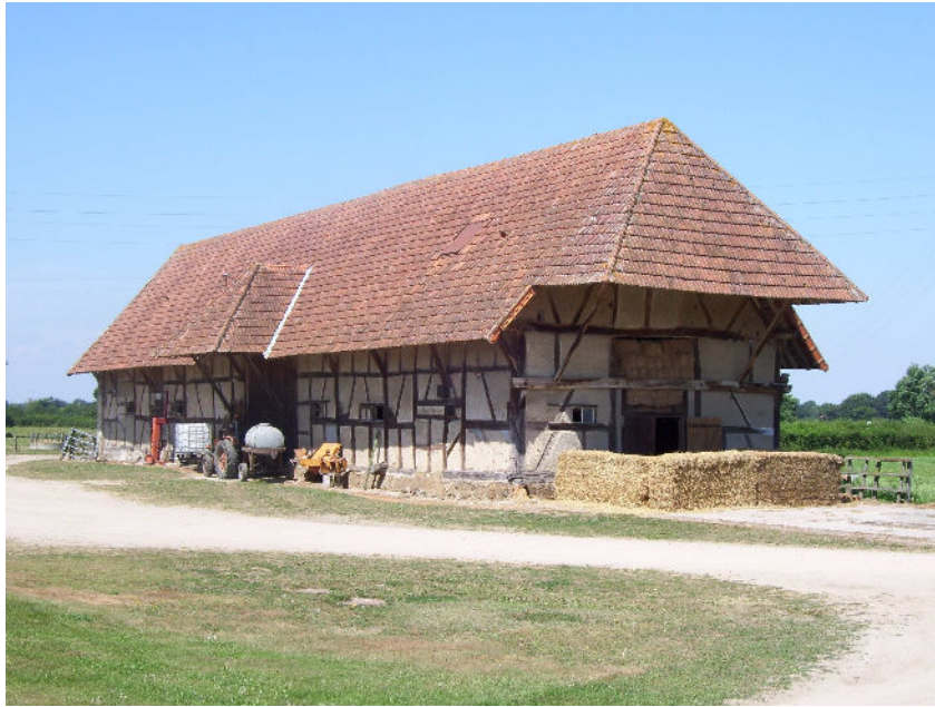
Grange des Mathés (Bien entendu seul les murs et la charpente sont d'époque).

La dîme de Saint Baudille continuera d'être perçue quand la chapelle aura disparu (bien qu'il n'y ait plus ni service, ni entretien à financer).